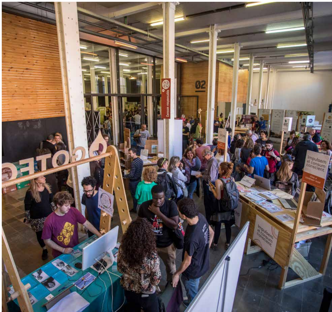
Al recinte de la Fabra i Coats de Sant Andreu de Palomar, s'aprofita la fira per fer intercooperació | VICTOR SERRI

Arran del pla estratègic aprovat el 2015, desenvolupa quatre grans eixos estratègics: relacions externes, incidència política i formació; economies feministes; xarxes territorials i sectorials, i mercat social. Totes aquestes accions s'articulen mitjançant una tretzena de comissions que cobreixen diferents àmbits. Al llarg dels darrers quinze anys, la XES ha participat en moltes accions de difusió de l'economia solidària, la intercooperació i la creació del mercat social. A banda de la fira, la XES promou el balanç social, impulsa una desena de xarxes locals i fa propostes d'impuls de l'economia solidària, com una nova manera de produir, distribuir i consumir, i que representa una alternativa viable i sostenible per satisfer les necessitats individuals i globals.