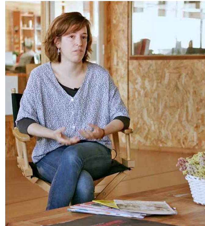
Una de les càpsules formatives de la Comissió d'Ecologia de la XES

Així doncs, si fa pocs anys la XES era el principal -i gairebé l'únic- espai des del que s'impulsava la intercooperació i la construcció de mercat social, el paisatge avui és el d'un ecosistema ric i divers, amb nous actors i eines rellevants. Però, de tots els reptes que planteja aquest creixement, segurament n'hi ha un que en sobresurt: Com es governa aquest ecosistema de mercat social? Quins espais podem generar per crear una estratègia comuna, i que reparteixi, en els diferents agents, les accions o línies de treball a dur a terme? La FESC serà un bon moment per plantejar aquestes preguntes. Us hi esperem.