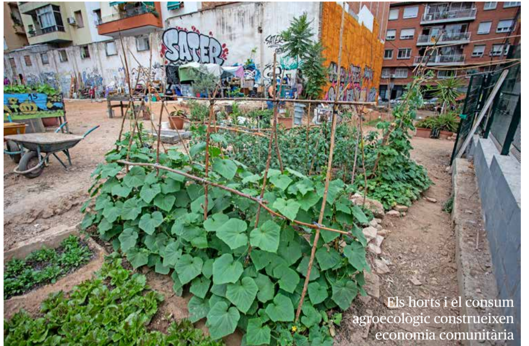
Els horts i el consum agroecològic construeixen economia comunitària

Volem aprofitar la FESC per trobar-nos, necessitem imaginar plegades un horitzó de cura digna, feminista i antiracista, que ens ajudi a definir una estratègia conjunta des del sector cooperatiu i solidari. Ens cal amb caràcter d'urgència, com a àmbit fonamental en la concertació pública-cooperativa-comunitària. En cas contrari, correm el risc que la provisió de cures continuï sent un nínxol de mercat en mans d'empreses mercantils de plataforma i grans empreses multiservei licitadores de serveis públics, amb sistemes d'atenció deshumanitzats i generadors de precarietat, que fan negoci amb la salut d'usuàries i treballadores, principalment dones, migrades i racialitzades.